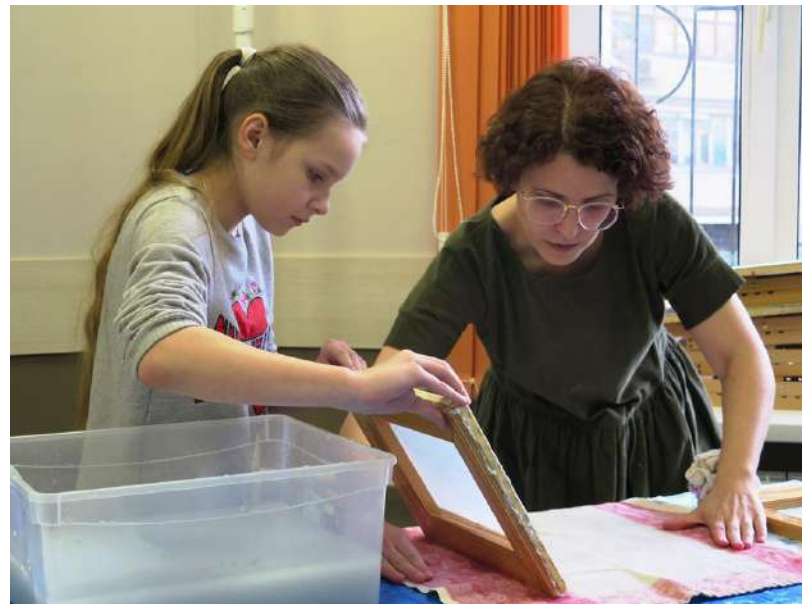
Мастер-класс «Бумага ручной работы»