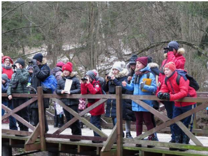
Акция «Серая шейка-2020»